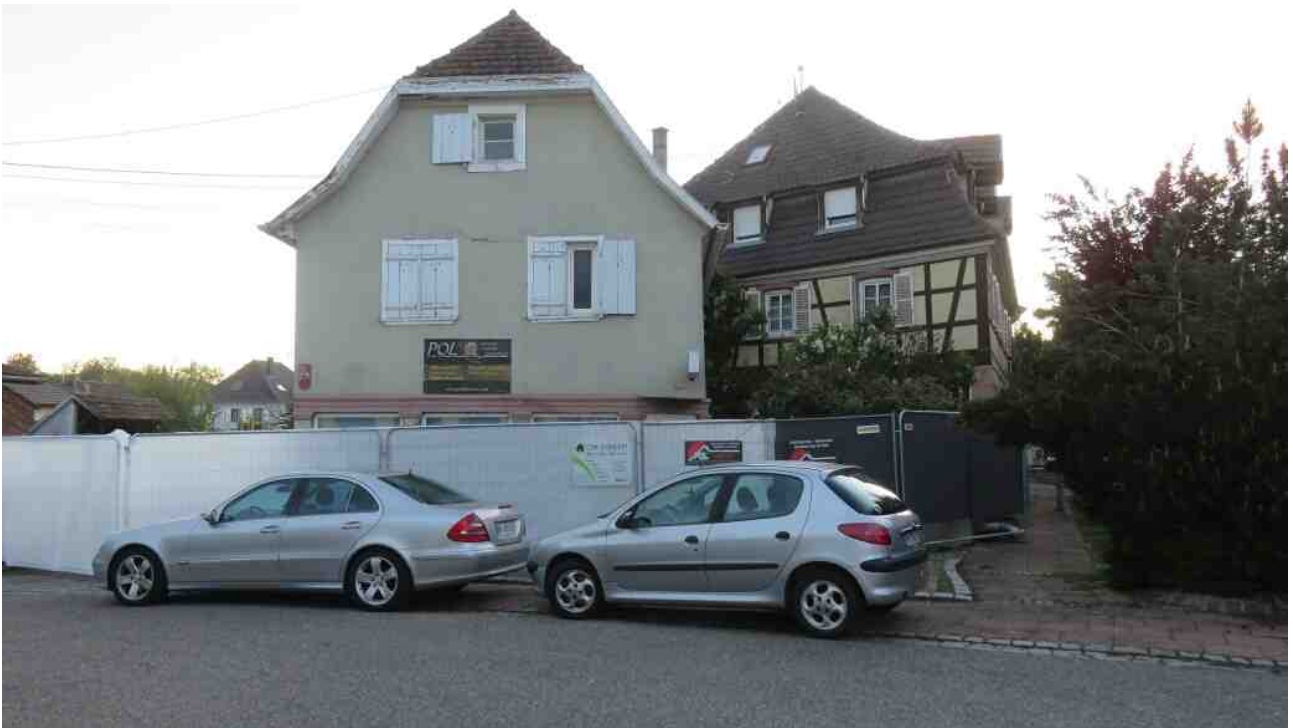
Maison natale de Geoffroy Velten à droite.

Et encore très récemment la démolition accordée pour un autre immeuble des 17e et 18e siècles, rue du Général Duport, a été évitée de justesse.